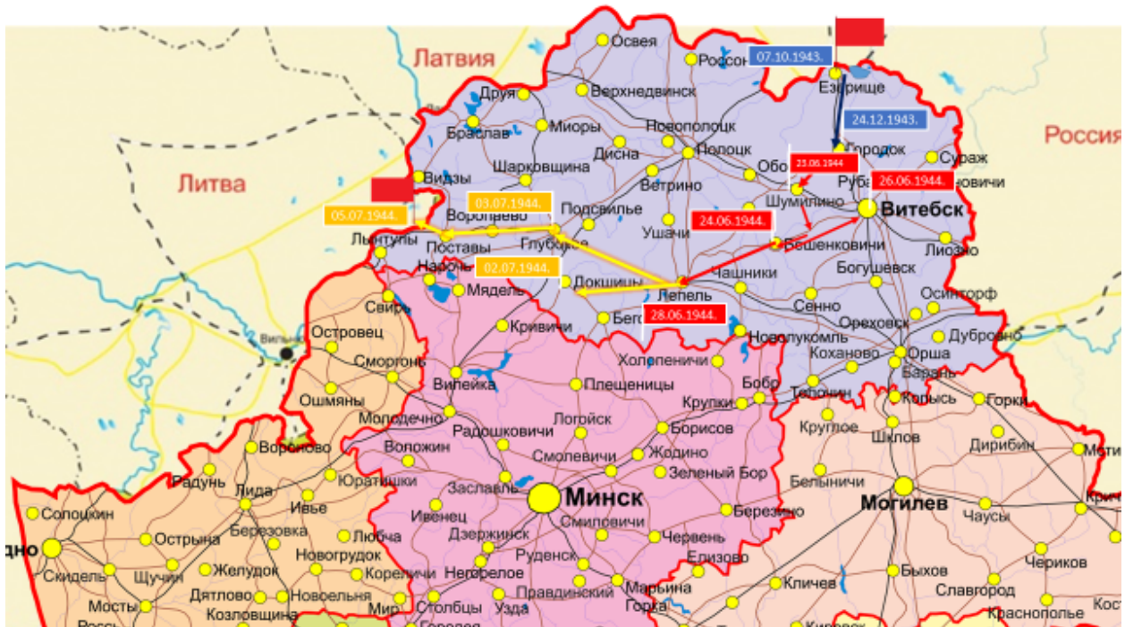
Карта передвижения войск Белобородова по Белоруссии.